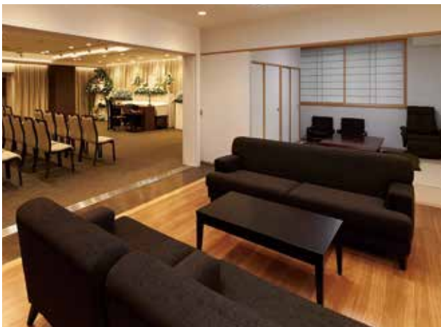
親族控室／浴室も備え、仮眠していただけます。