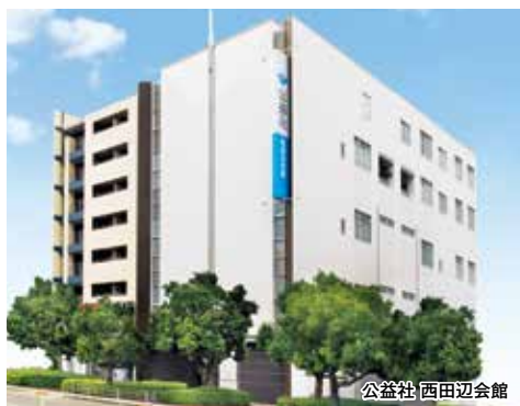
公益社 西田辺会館

※9/23(金・祝)~24(土)の写真・人形供養の受付は平野会館のみとなります。