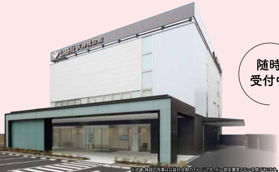
※式場・施設の写真は公益社会館のイメージです。※一部安置室のない会館があります。

2022年 12/9 金 場所:公益社 学園前会館 個別相談会 開催! 詳しくは裏面をご覧ください