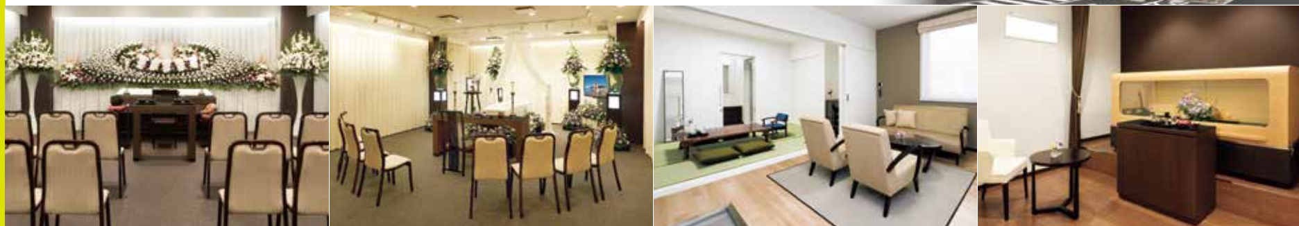
※式場・施設の写真は公益社の会館のイメージです。