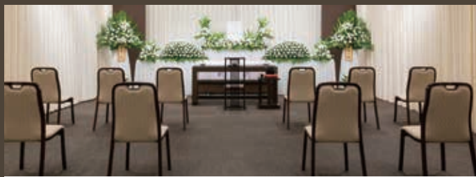
ソーシャルディスタンスに配慮した席配列の式場