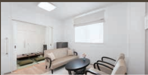
自宅のようにくつろげる親族控室