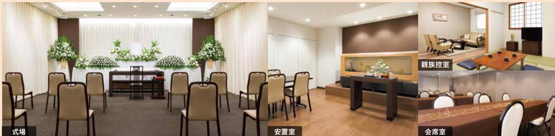
※施設の写真は公益社の会館のイメージです。