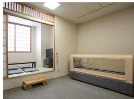
安置室 / 病院から直接ご入館いただけます。