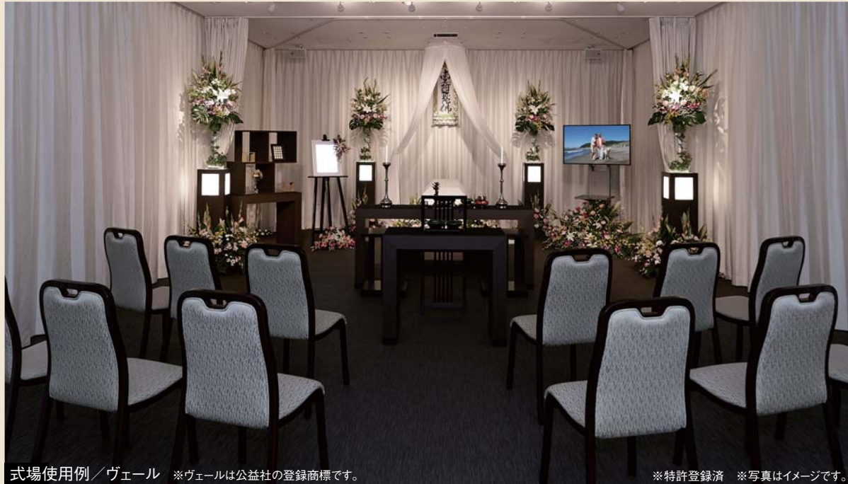
式場使用例/ヴェール ※ヴェールは公益社の登録商標です。