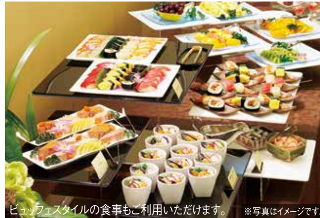
ビュッフェスタイルの食事もご利用いただけます。 ※写真はイメージです。