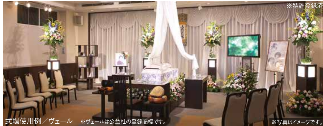
式場使用例／ヴェール ※ヴェールは公益社の登録商標です。