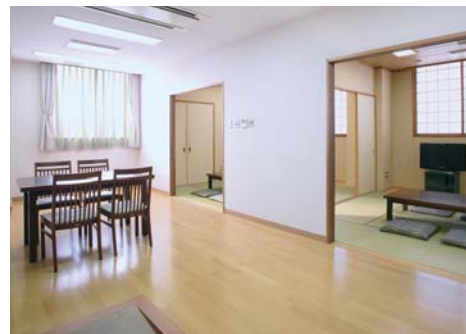
親族控室 / 浴室も備え、仮眠していただけます。