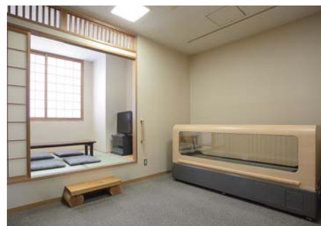
安置室 / 病院から直接ご入館いただけます。