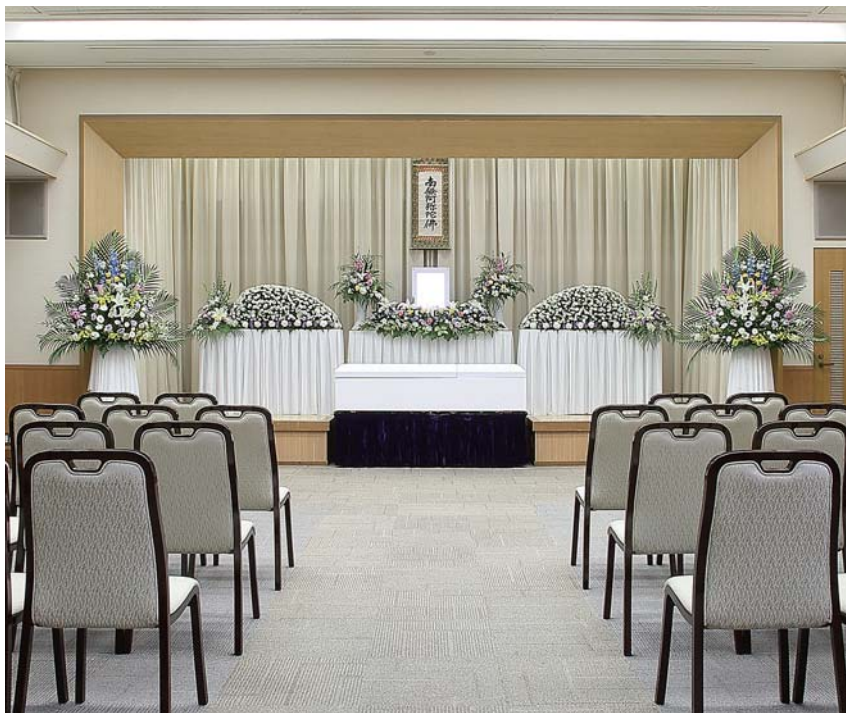
式場 / 人数に合わせて、レイアウトの変更が可能です。