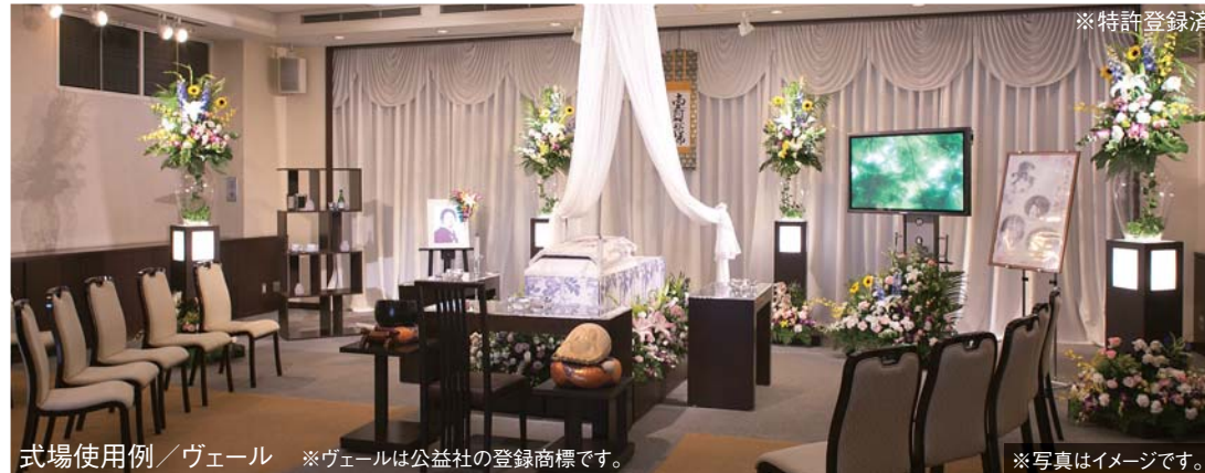
式場使用例／ヴェール ※ヴェールは公益社の登録商標です。