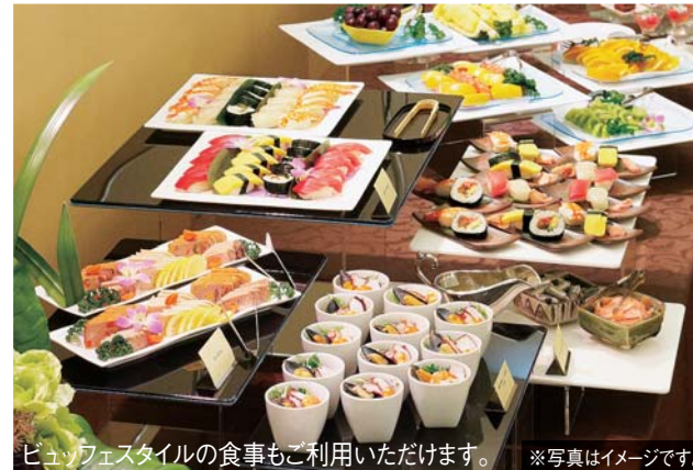
ビュッフェスタイルの食事もご利用いただけます。 ※写真はイメージです。