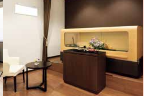
※式場・施設の写真は公益社の会館のイメージです。