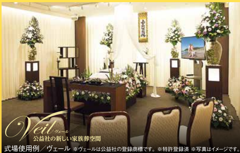
式場使用例/ヴェール ※ヴェールは公益社の登録商標です。※特許登録済 ※写真はイメージです。